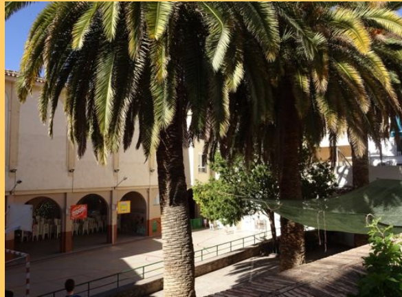
Schulhof unter Palmen in Jaën, Andalusien

Im Mai fand ein vorbereitender Besuch für eine Schulpartnerschaft mit der Druze Friendship School in Yarka statt. Geplant ist ein Schüleraustausch im November 2017. Yarka ist eine drusische Gemeinde, die im Norden Israels liegt. Programmpunkte können sein Besuche in Akko, Tel Aviv, Haifa, am See Genezareth und in den Golanhöhen. Ein wesentlicher Bestandteil eines Israelbesuches ist selbstverständlich auch die Besichtigung der Holocaust-Gedenkstätte Yad Vashem. Projekte in den Fächern Sozialwissenschaften, Kunst, Geschichte richten sich an Schüler und Schülerinnen der gymnasialen Oberstufe. In Israel sind Modernität und eine über zweitausendjährige Geschichte verbunden mit einer besonderen Gastfreundschaft erfahrbar.