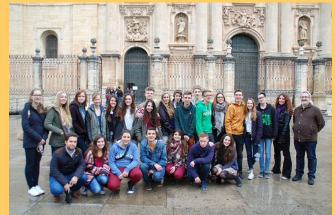
vor der Kathedrale in Jaèn, Spanien