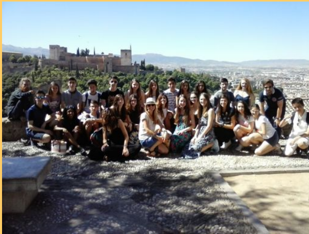
Blick auf die Alhambra von Granada