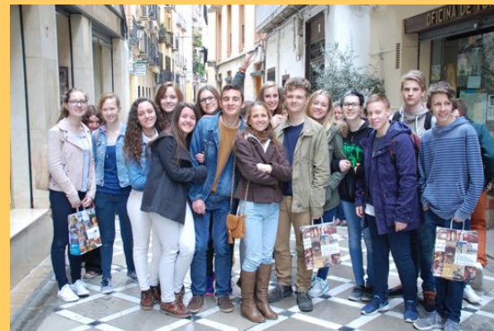
Stadtbummel in Jaèn